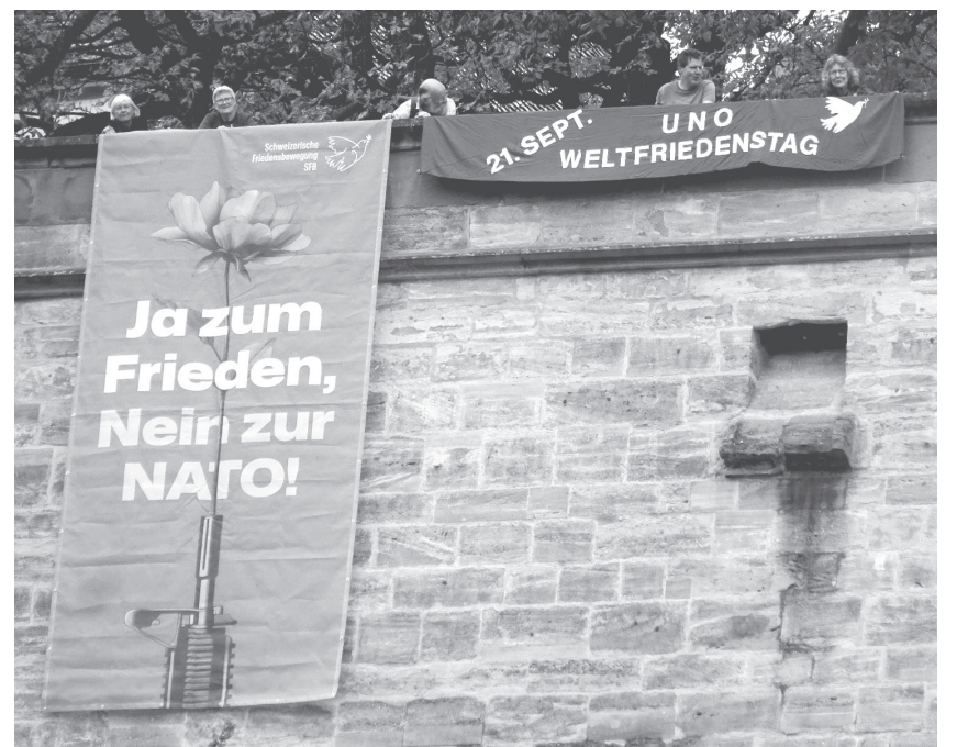
Aktion der Friedensbewegung in Basel am 21. September.

Quelle: Der Neue Norden , Nr. 6. Abo für die Zeitschrift Der Neue Norden : per Telefon unter 032 517 81 81 oder per Mail an neuepresse@gmx.ch