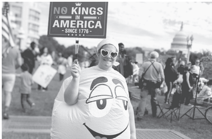
«No Kings»-Protest in Washington, D.C.