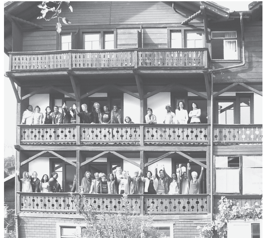
Koordinatorinnentreffen für das Friedensnobelpreis-Projekt.