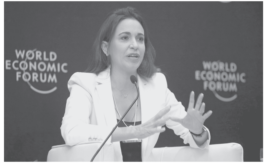
Maria Corina Machado am WEF in Rio de Janeiro, Brasilien, 2011.

Diese imperialistische Denkweise wurde von Beginn an von der sozialistischen Bewegung in Frage gestellt. Für sie war und ist der Kampf für den Frieden ein integraler Bestandteil des Klassenkampfes. In den imperialistischen Zentren Europas und der USA musste die Arbeiter:innenklasse gegen