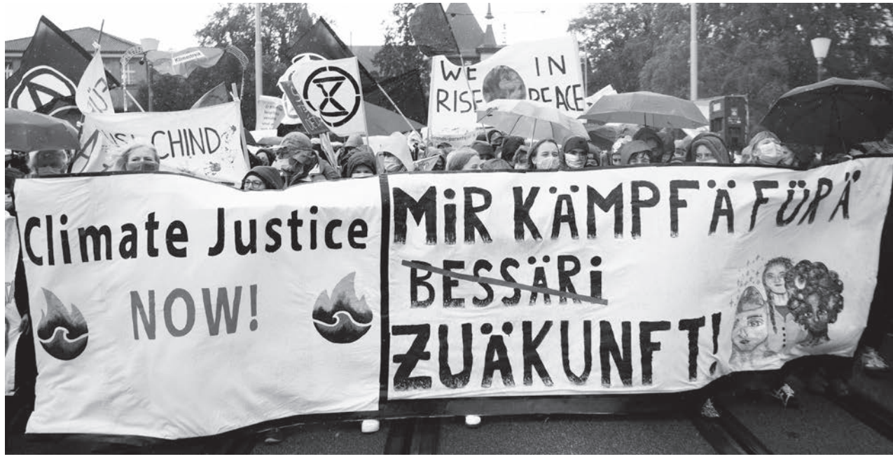
Kundgebung vom 25. September 2020 nach der behördlich verfügten Auflösung des Protestcamps.