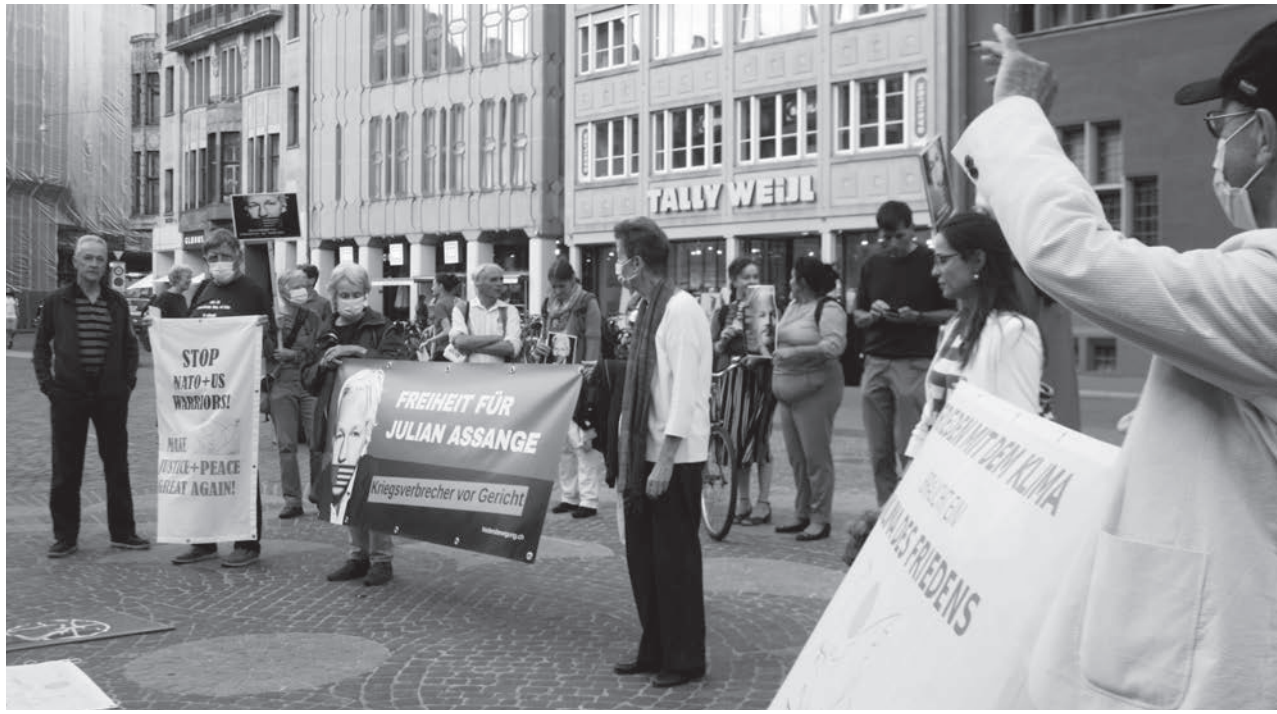
Weltfriedenstag vom 21. September 2020: Mahnwache der Schweizerischen Friedensbewegung für Julian Assange auf dem Basler Marktplatz.