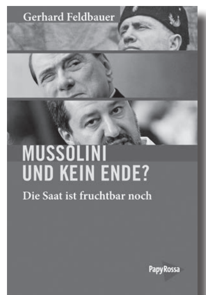
Gerhard Feldbauer, Mussolini und kein Ende? Die Saat ist fruchtbar noch. PapyRossa, Köln 2020

In dem ab Januar völkerrechtlich bindenden Dokument verpflichten sich die Unterzeichnerstaaten, «nie, unter keinen Umständen» Atomwaffen zu entwickeln, herzustellen, anzuschaffen, zu besitzen oder zu lagern. Der Vertrag geht auf eine Initiative der Internationalen Kampagne zur Atomaren Abrüstung (ICAN) zurück, die 2017 den Friedensnobelpreis erhielt, und ist eine Honorierung des Jahrzehnte dauernden hartnäckigen Einsatzes der weltweiten Friedensbewegung zur Ächtung und Eliminierung der Atombomben. (UZ/UW)