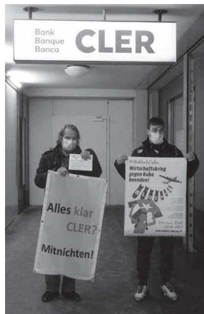
Wie hier in Bern fanden am 27. Oktober in verschiedenen Schweizer Städten vor den Filialen der Bank CLER Mahnwachen gegen die Komplizenschaft der Bank mit der antikubanischen Politik der USA statt.