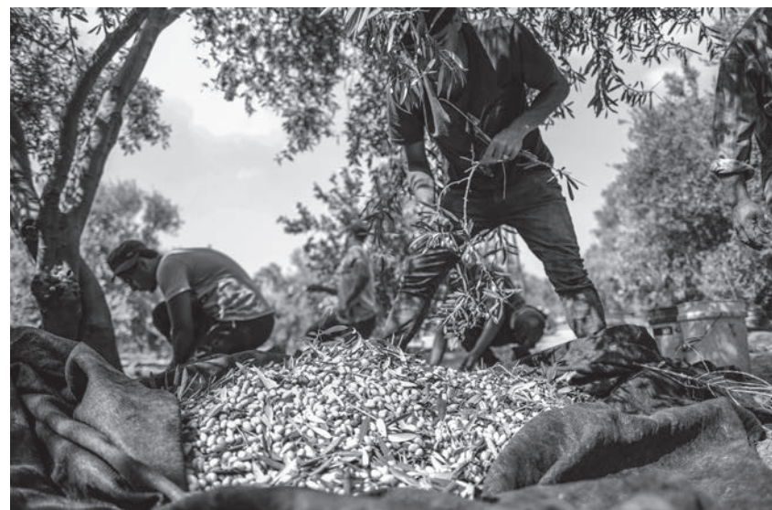
Olivenernte im Gazastreifen.

Wenn ich Sie wäre, würde ich für Sie Schiwa sitzen, denn Sie haben dem Wesen des Judentums abgeschworen und die Prinzipien in seinem Innern