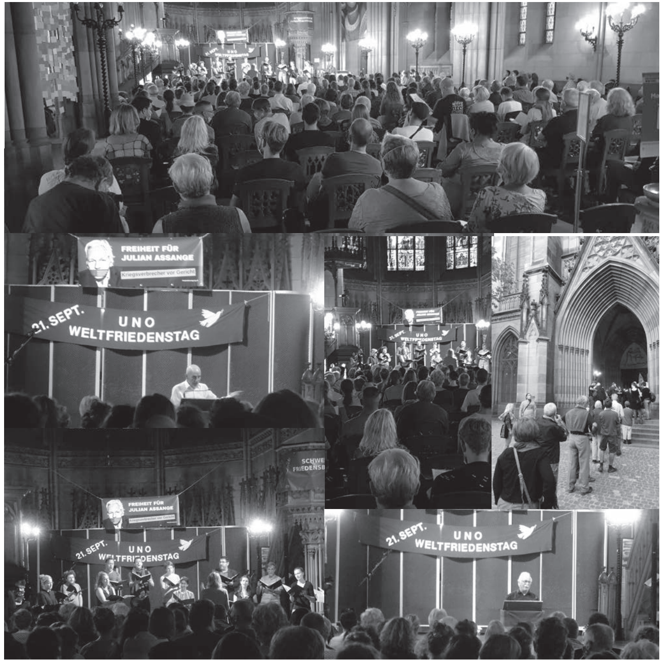
Impressionen vom Weltfriedenstag in der Basler Elisabethenkirche.

Der Kampf für eine bessere Gesellschaft, für den Sozialismus, ist für mich unweigerlich mit dem Kampf für Frieden und mit Antiimperialismus und Antimilitarismus verbunden. Die SFB ist die einzige Friedensorganisation in der Schweiz, die diese Werte konsequent verkörpert. Entsprechend freue ich mich darauf, bald in der Redaktion von «Unsere Welt» aktiv mitschreiben und mitarbeiten zu können.