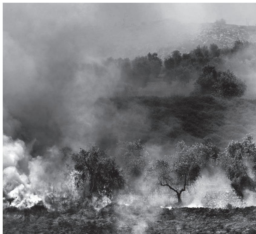
Brennende Olivenbäume in Nablus. Palästinensische Bauern sind den brandschatzenden Vandalen aus den illegalen Hügel-siedlungen hilflos ausgesetzt.