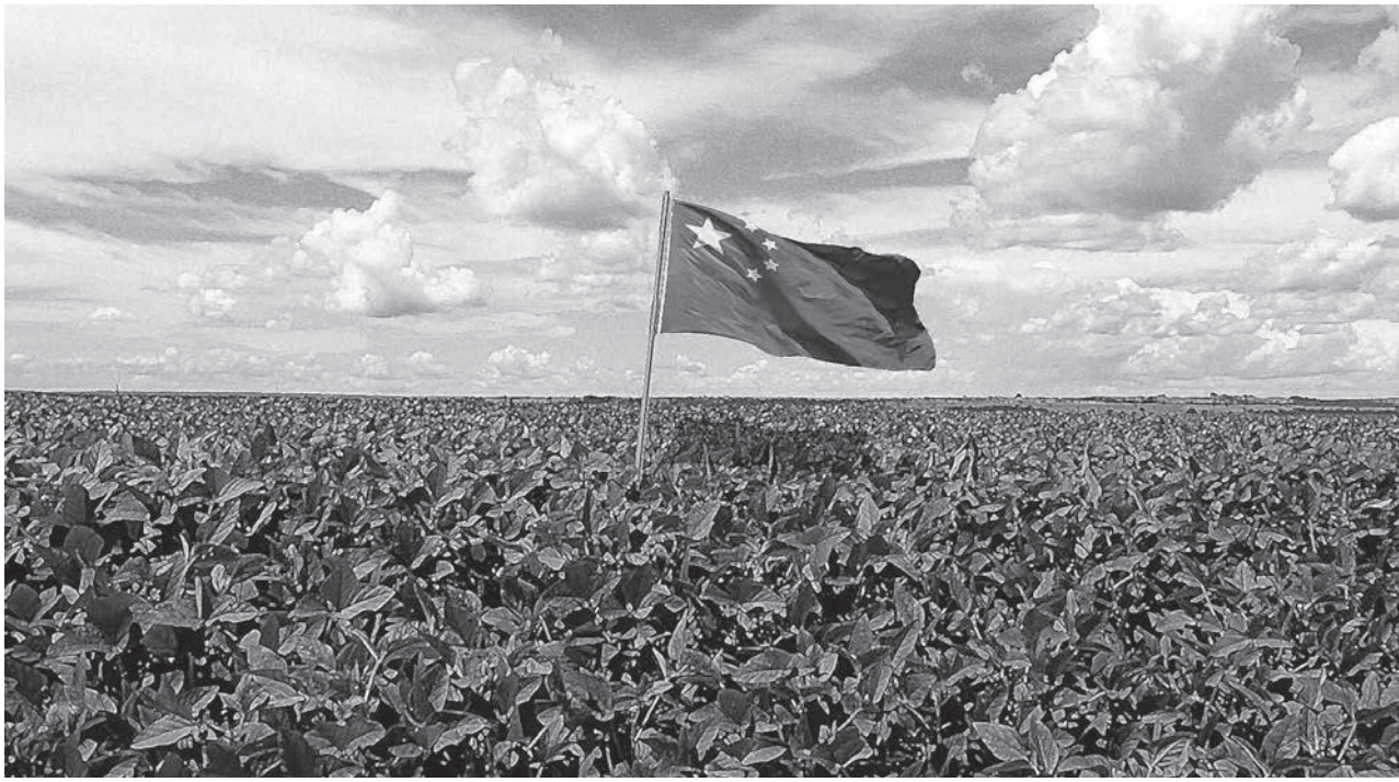
Chinesische Flagge über lateinamerikanischen Sojafeldern.

Veränderte Essgewohnheiten schaffen neuen Bedarf