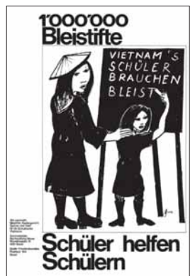
Untrennbar verbunden mit der 60jährigen Geschichte der Schweizerischen Friedensbewegung: Die Solidarität mit Vietnam (Sammelaktion der SFB aus den siebziger Jahren).

Das nervt zwar manchen der dynamischen Jungunternehmer, die sich nicht selten als eine Art «Ein-Familien-AG» entpuppen, findet aber in der Bevölkerung allgemein Zustimmung. Wie auch die Verehrung Ho Chi Minhs, dessen Konterfei man überall im Strassenbild findet. Auch im Postamt der nach ihm benannten Stadt, das unter französischer Kolonialherrschaft von Gustave Eiffel gebaut