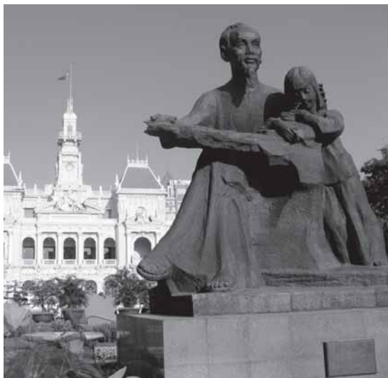
Nach wie vor hochverehrt: Statue in Ho Chi Minh-City zu Ehren des vietnamesischen Volkshelden «Onkel Ho».