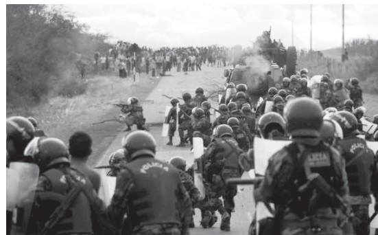
Gehaltene Kraft der Unterdrücker: Peruanische Polizei schießt auf demonstrierende Indigenas.

Quelle: PeaceNews/mag.de. Übersetzt von Eva-Maria Bach, von der Redaktion gekürzt.