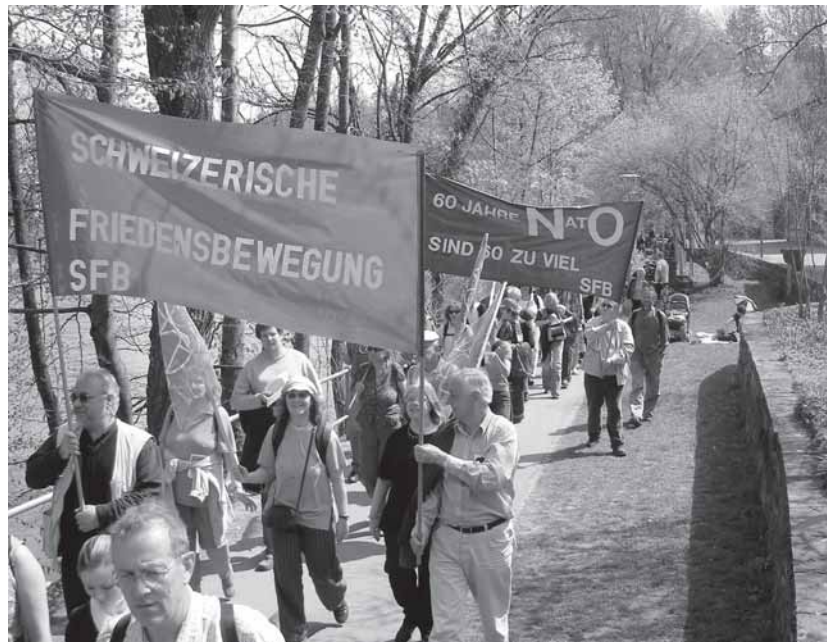
60 Jahre NATO sind sechzig Jahre zuviel: Die starke Delegation der Schweizerischen Friedensbewegung SFB am Berner Ostermarsch 2009.

(Zusammenfassung eines Vortrages, den Rainer Rupp am 23. März 2009 in Basel gehalten hat.)