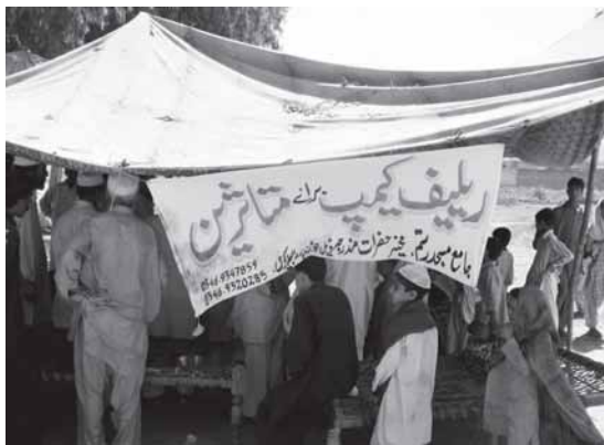
Camp für Flüchtlinge aus Buner.

Sachlich steht diese These auf wackligen Füüssen. Die Stärke der Taliban ist ihre Verbindung zu Teilen der paschtunischen Bevölkerung in der Nordwest-Grenzprovinz und den Stammesgebieten. Jenseits des Nordwestens sind ihr Einfluss und ihre militärischen Möglichkeiten, aber auch ihre Ambitionen gering. Das Horrorszenerario, die fundamentalistischen Kämpfern stünden 100 Kilometer vor Islamabad, ist zwar propagandistisch ergebnis – besonders aussserhalb Pakistans –, täuscht aber über die Realität hinweg.