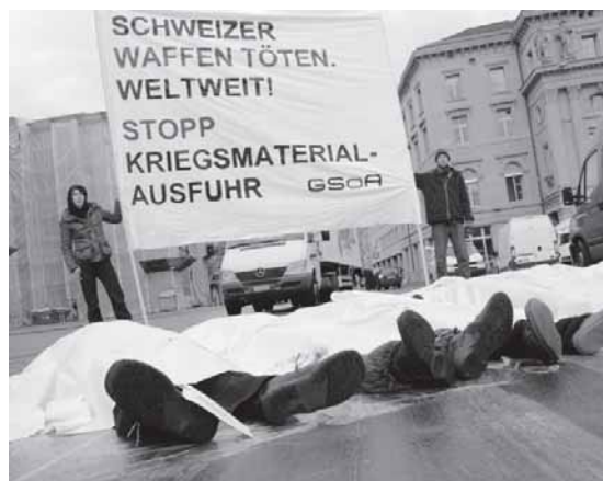
Anlässlich der Debatte über die Volksinitiative für ein Verbot von Kriegsmaterial-Exporten im Nationalrat von Mitte März 2009 veranschaulichten GSOA-AktivistInnen auf dem Bundesplatz die Folgen des Geschäfts mit dem Krieg (Foto GSOA).

Waffenplatz Schweiz, Beiträge zur schweizerischen Rüstungsindustrie und Waffenausfuhr, Herausgeber: Tagungssekretariat «Für das Leben produzieren», Arbeitsgemeinschaft für Rüstungskontrolle und ein Waffenausfuhrverbot (ARW), 1983.