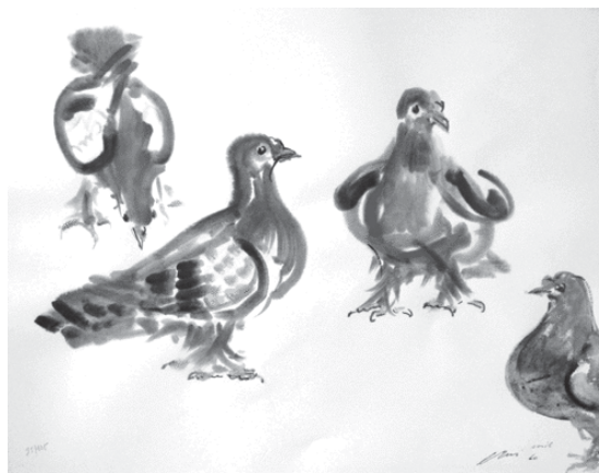
Der weltbekannte Schweizer Künstler Hans Erni, dessen 100. Geburtstag wir kürzlich feiern konnten, schuf diese Friedenstauben 1960 als Hommage an die Friedensbewegung. Die original Farblithographie ist im Stein signiert und wurde in 125 nummerierten Exemplaren auf Arches-Velin gedruckt. Das 56 x 76 cm grosse Werk ErnIs, das er dem französischen Mouvement de la Paix zur Verfügung stellte, kann zum Preis von Fr. 150.– bei der Schweizerischen Friedensbewegung SFB, Postfach 2113, 4001 Basel bezogen werden (Berücksichtigung nach Bestellungseingang).

und jetzt detailgetreu rekonstruiert wurde – mit einem wichtigen Zusatz: einem riesigen Bild des Volkshelden in der Schalterhalle. Selbst USA-Präsident Bush musste bei seinem Vietnambesuch anlässlich des APEC-Gipfels 2006 unter einer überlebensgrossen Bronzebüste Ho Chi Minhs Platz nehmen. Und auch die Saigoner Börsenjobber unterwerfen sich patriotischem Pragmatismus – indem sie sich bei ihren Geschäften am «Ho-Chi-Minh-Index» orientieren. (Quelle: ND)