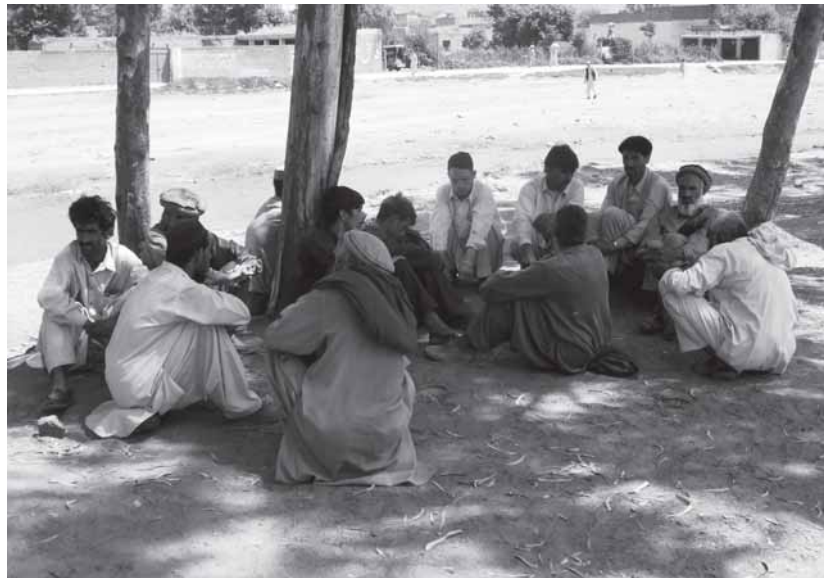
Auf der Flucht: 3,4 Millionen Pakistani wurden bisher gezwungen, alles Hab und Gut binnen weniger Stunden aufzugeben (Flüchtlingslager bei Rostum. Foto Atif Mumtaz)