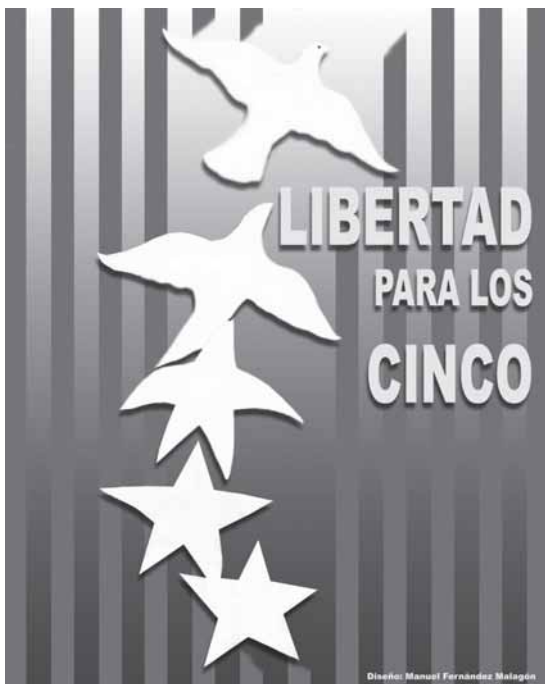
«Freiheit für die Fünf»: 1998 wurden in Miami fünf Kubaner wegen angeblicher Spionage zu langen Gefängnisstrafen verurteilt und sitzen seither in Einzelhaft, zum Teil ohne Besuchsrecht ihrer Angehörigen. Ihr Verbrechen: Sie infiltrierten exilkubanische Terrorgruppen und verhinderten mit ihren Informationen, die auch dem FBI übergeben wurden, Anschläge auf Menschen und Einrichtungen in Kuba. Plakat: Manuel Fernández Malagón.