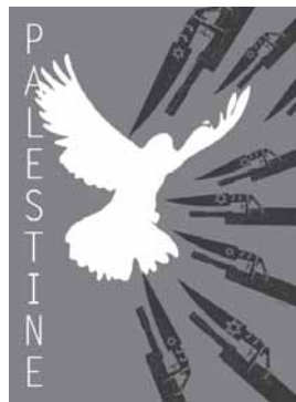
Poster von Abdol Hoseni

Binyamin Netanyahu hat eine ähnliche Vision, bezeichnet es aber anders: die Araber werden «sich selbst regieren.» Sie werden ihre Städte und Dörfer regieren, aber nicht das Land, weder die Westbank noch den Gazastreifen. Sie werden natürlich keine Armee haben und keine Kontrolle über den Luftraum über ihren Köpfen und keinen direkten Kontakt mit den