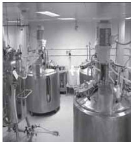
Das etwas andere Kuba: Hochleistungslabors im CIGB.