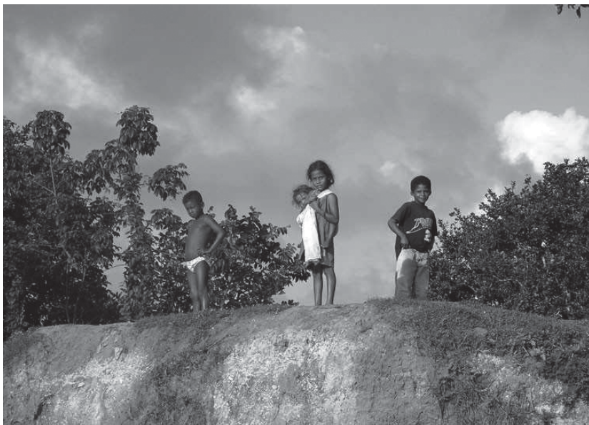
Misstrauisch und neugierig: Kinder verschiedener Ethnien in der Moskitia beäugen die Ankunft kubanischer Ärzte und Pflegefachpersonen.

brigaden die Einreise. Wir schickten Woche für Woche immer wieder neue Gruppen, Ausrüstungen, Medikamente, Feldlazarette etc. und Ende November waren wir bereits bei 123 Spezialisten angelangt.» Nach sechs Monaten hatten die kubanischen Ärzte und Pflegefachpersonen über 600 Gemeinden besucht, 250 000 Menschen behandelt und um die 4000 Operationen durchgeführt.