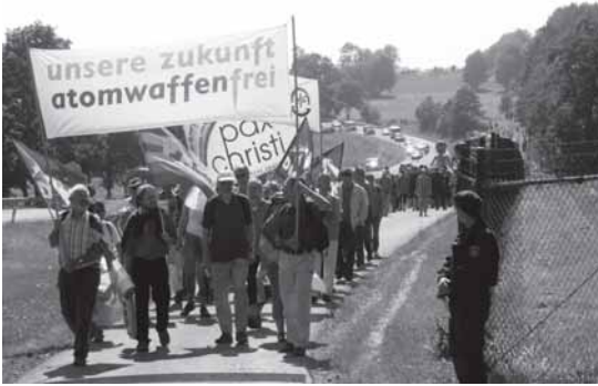
Kundgebung von August 2008 gegen Atomwaffen vor der US-Nuklearbasis in Büchel, Deutschland.