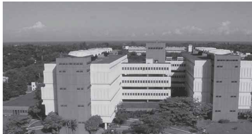
Das Zentrum für Gentechnik und Biotechnologie im Westen Havannas. 550 Wissenschaftler und Ingenieure arbeiten hier an über 50 verschiedenen Forschungsprojekten.